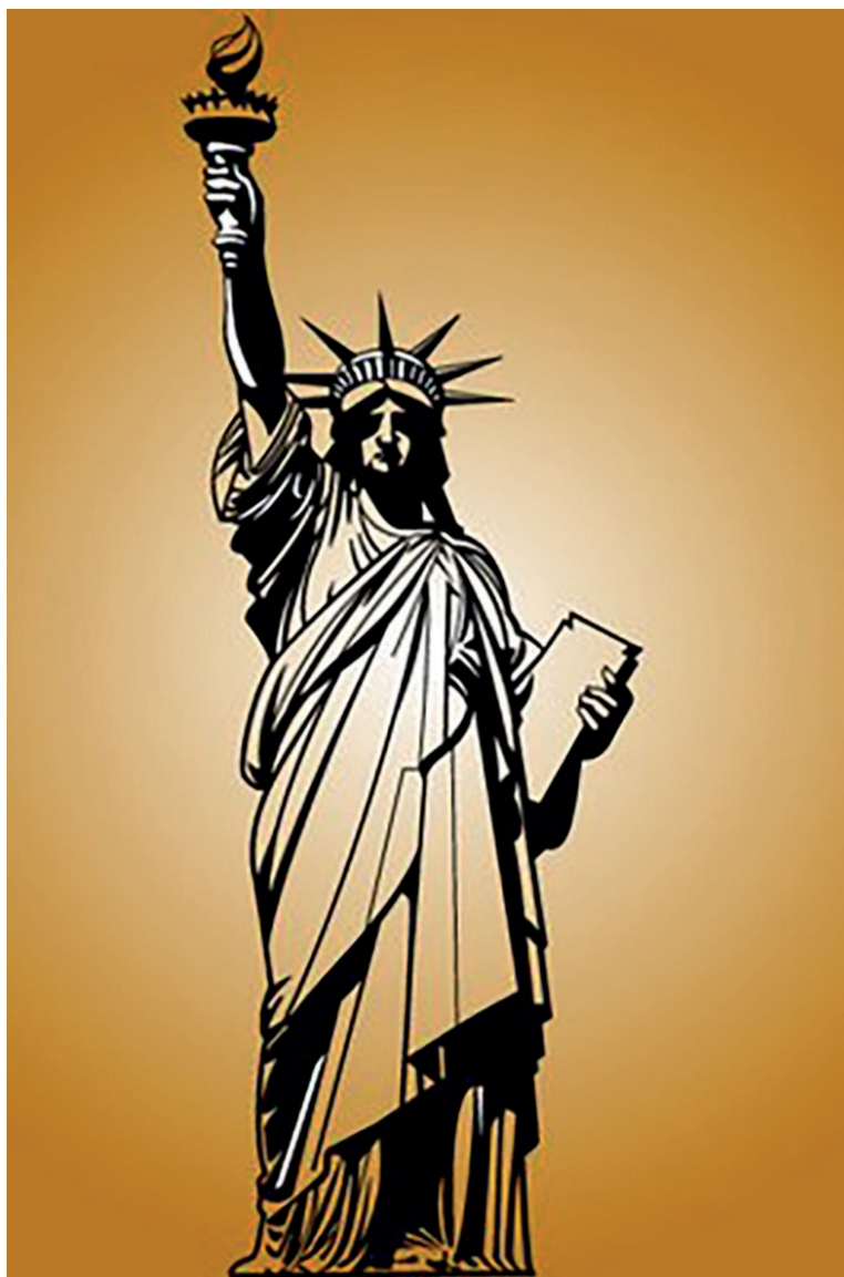
Estatua de la libertad