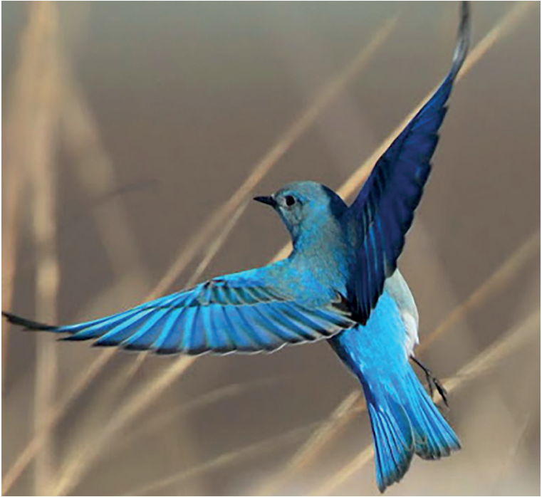
Hacedor de sueños. Pájaro azul